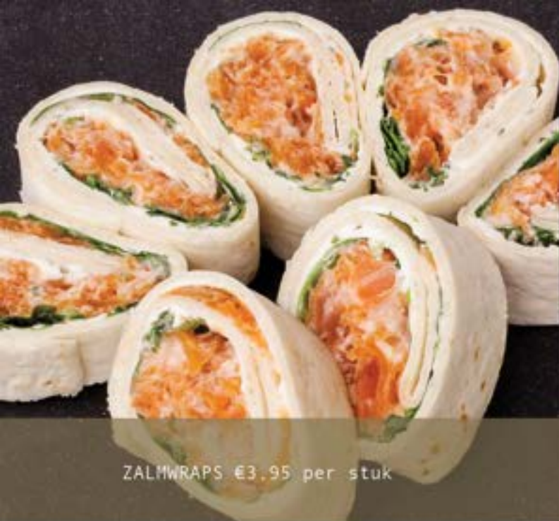
ZALMWRAPS €3.95 per stuk