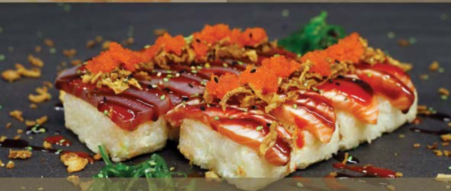
HUISGEMAAKTE SUSHI MIGIRI €14.50 - 8 stukjes