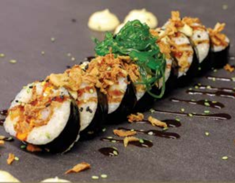
SUSHI GAMBA €12.95 per rol