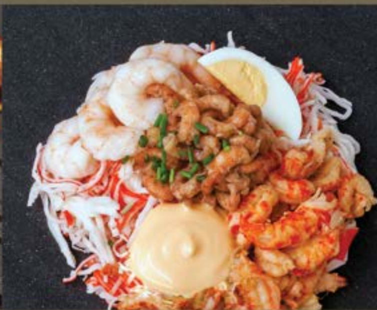
LEIDSE COCKTAIL €3,95 (2 voor €7,50)