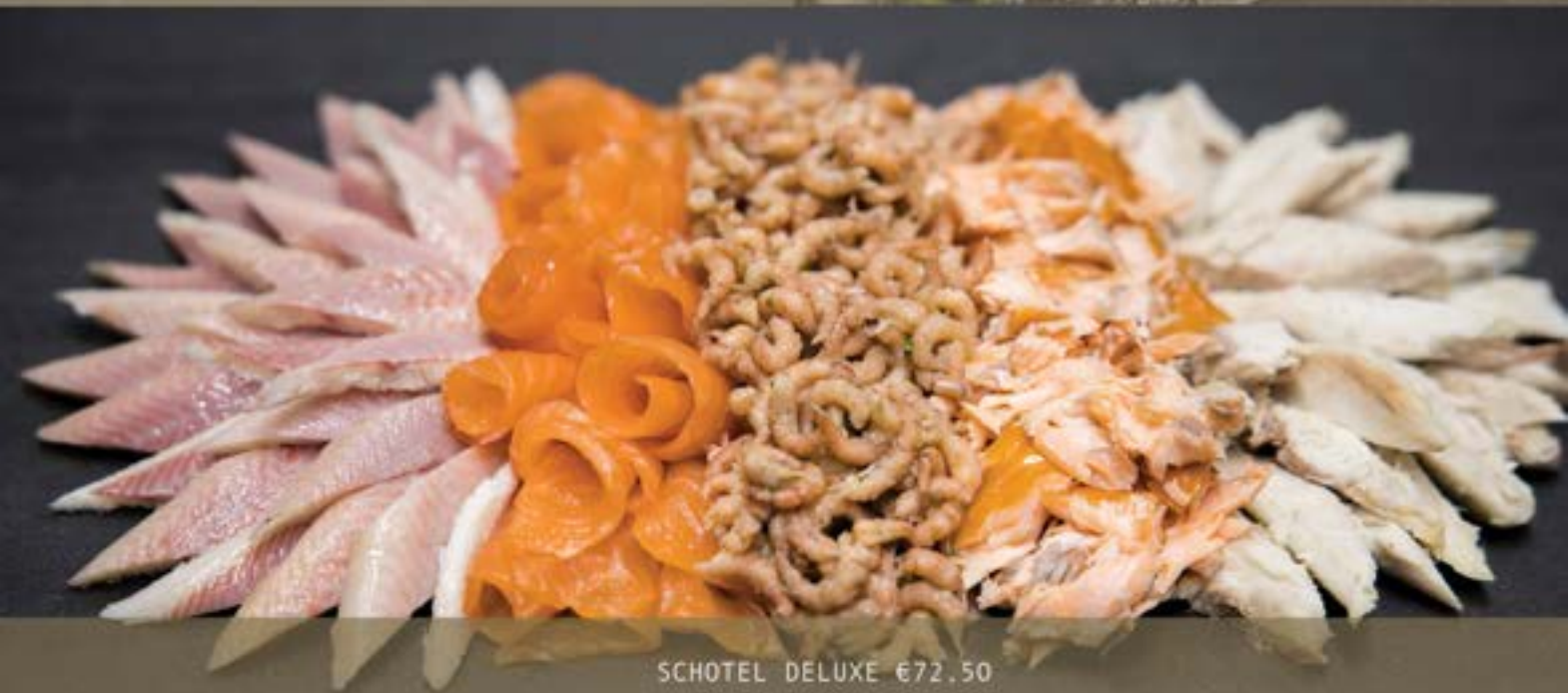
SCHOTEL DELUXE €72.50