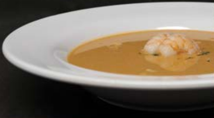
KREEFTENSOEP €6,95 1/2 liter