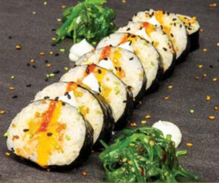
SUSHI SMOKED SALMON €12.95 per rol