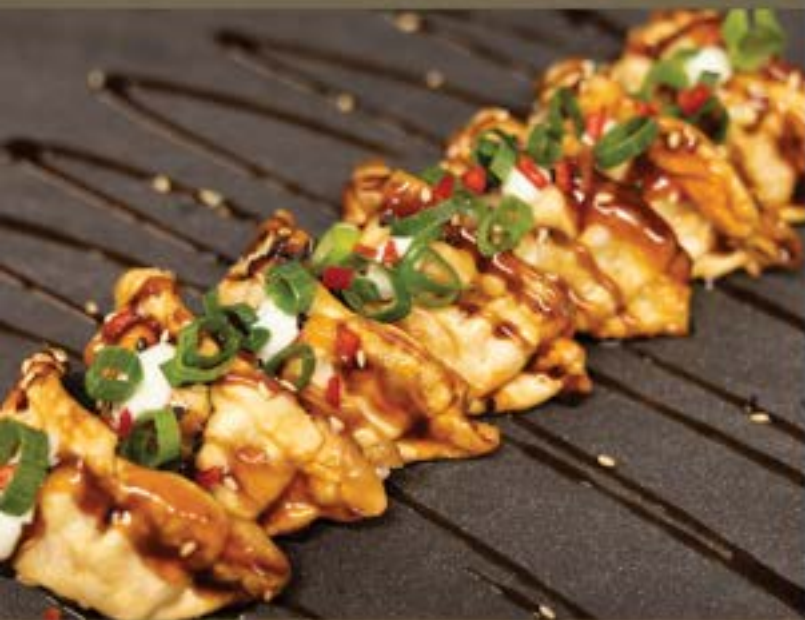
GYOZAHAPJES, 7 stuks €7,95