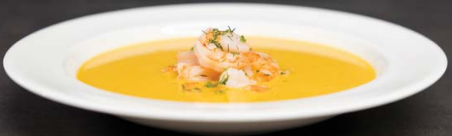
POMPOEN / GAMBA SOEP €6,95 1/2 liter