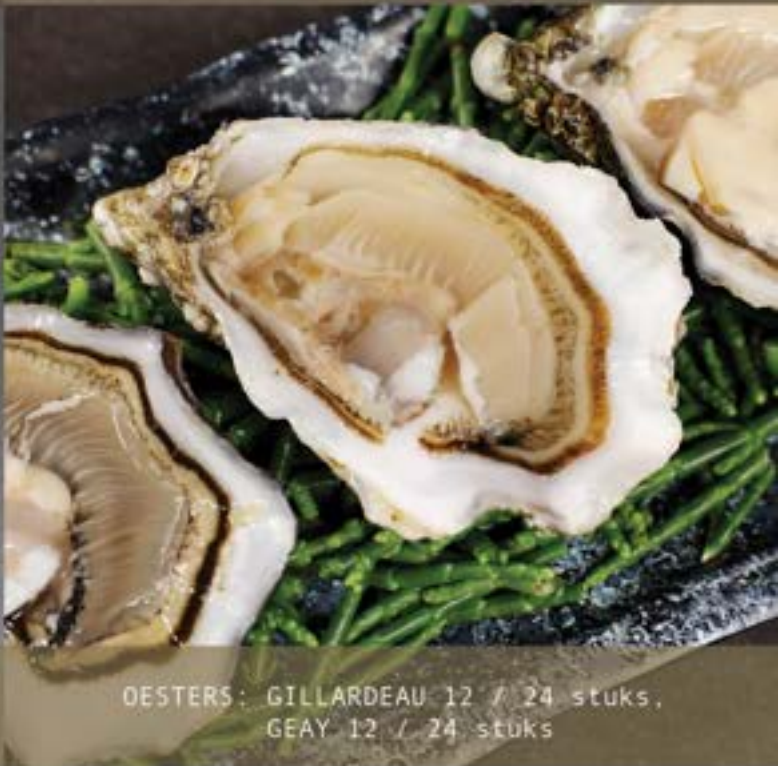
OESTERS: GILLARDEAU 12 / 24 stuks, GEAY 12 / 24 stuks