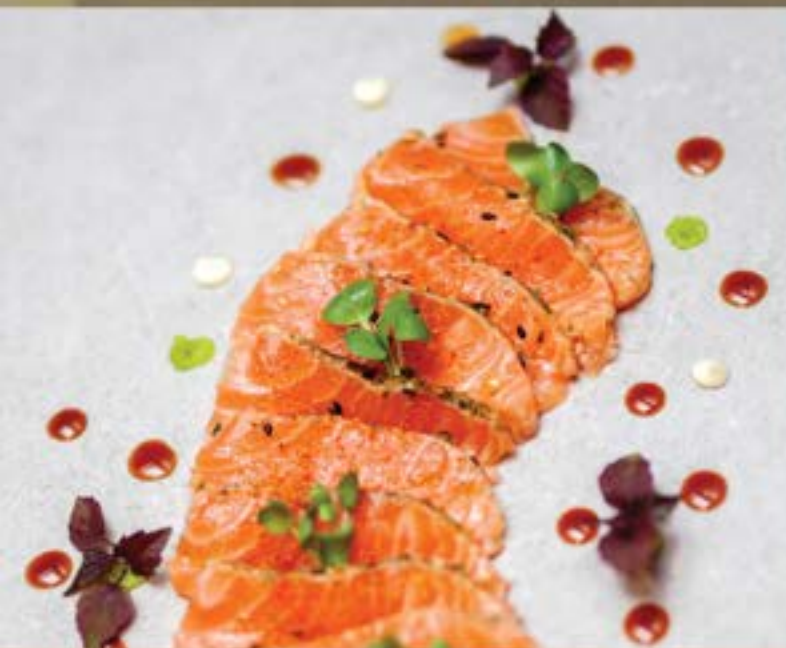
ZALM TATAKI €7.95 per portie