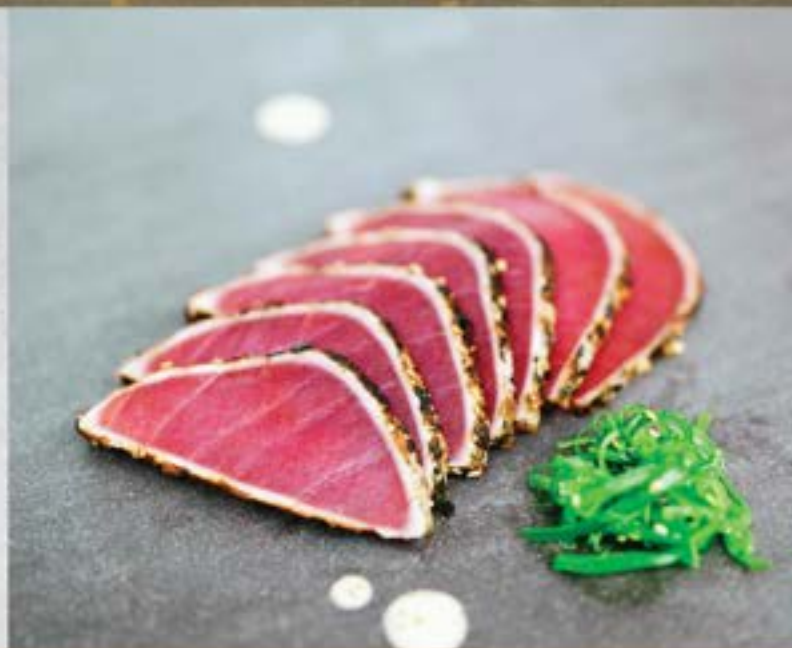
TONIJN TATAKI €9.50 per portie